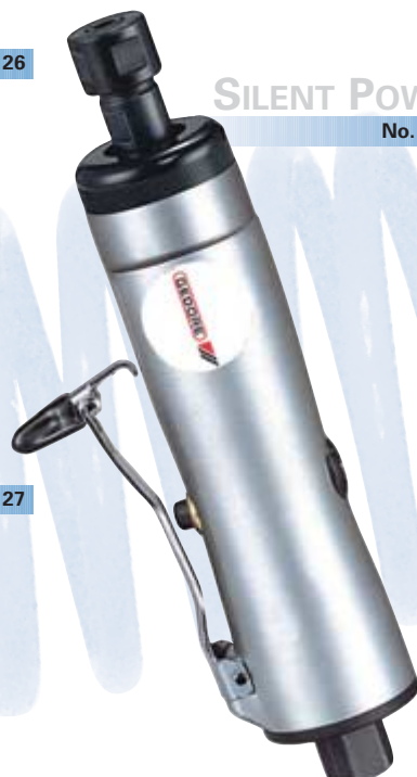
SILENT POWER No. 5124