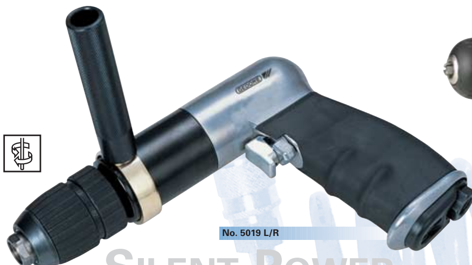
No. 5019 L/R