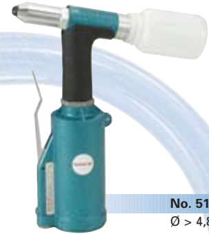
No. 5135 Ø > 4,8