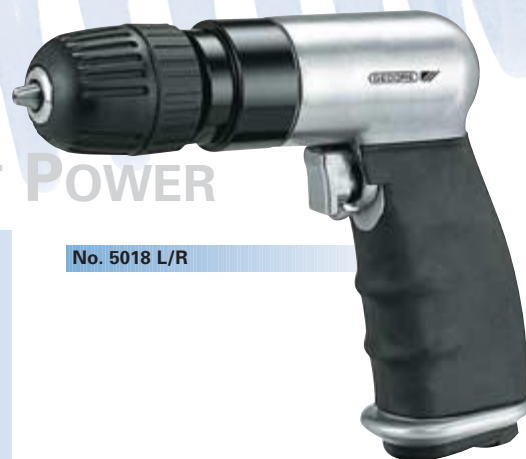
No. 5018 L/R

Technische daten données techniques specifications