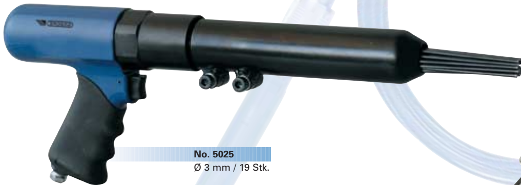
No. 5025 Ø 3 mm / 19 Stk.